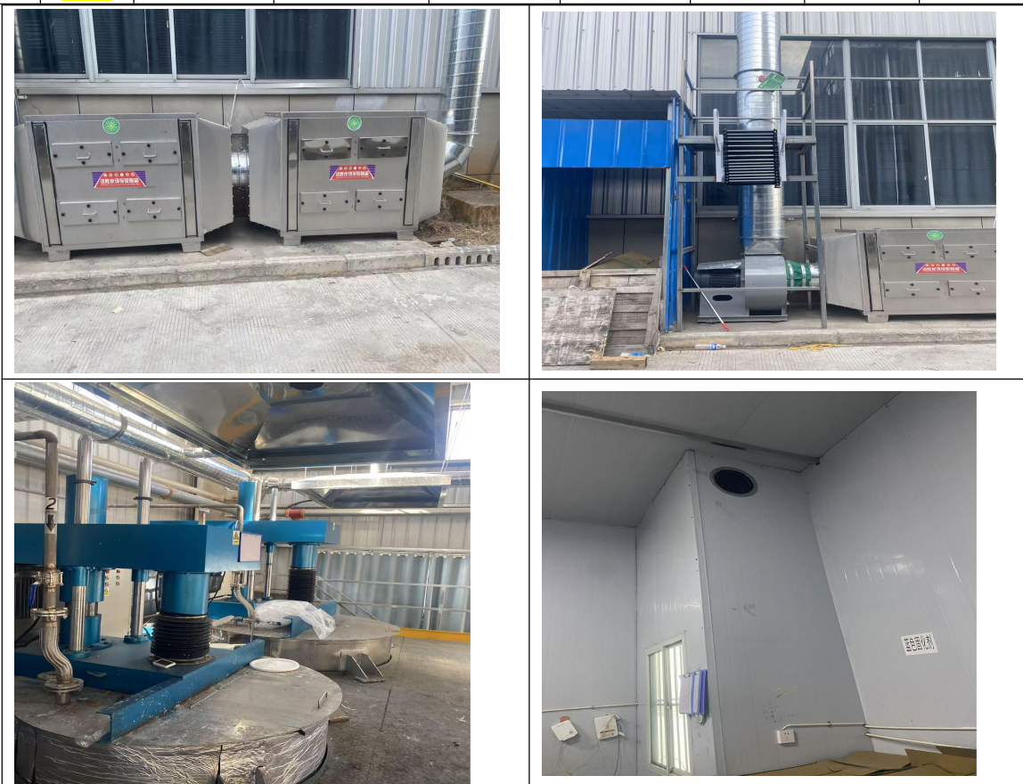
图 4.1-3 废气治理措施及排气筒照片